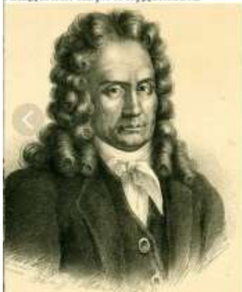
Лаврентий Лаврентьевич Блюментрост (1692—1755) — первый президент Петербургской Академии наук и художеств